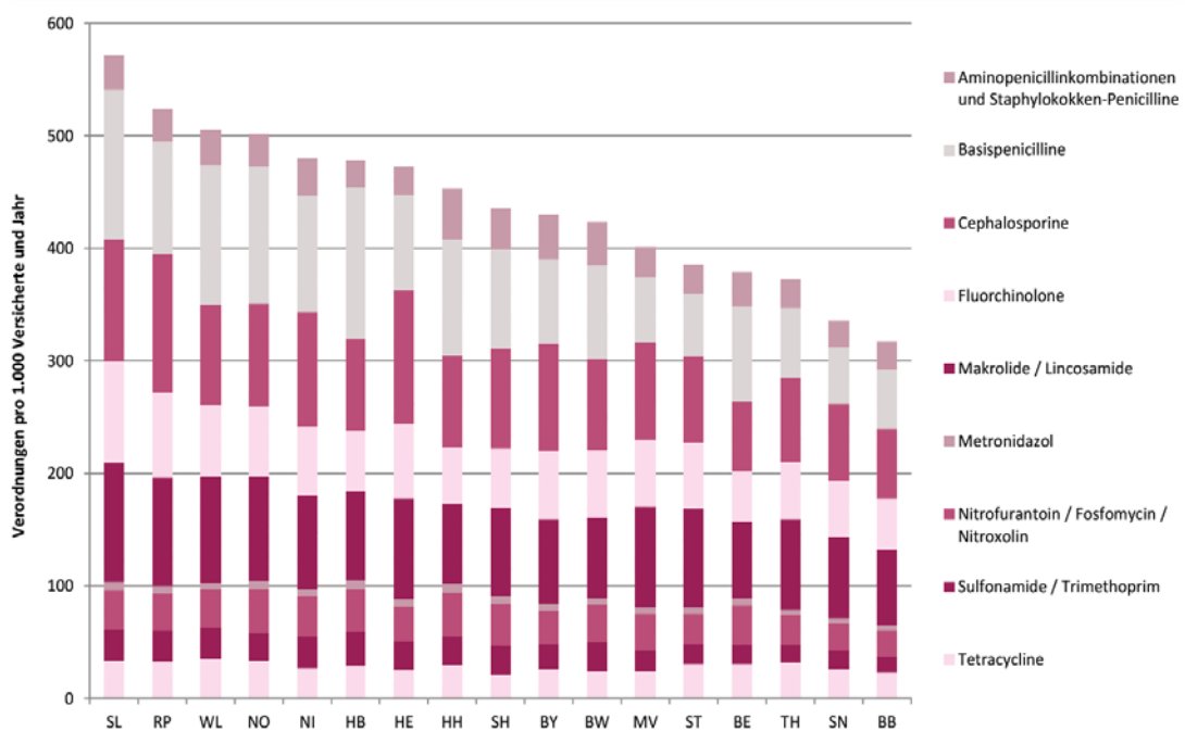
Abbildung 2: Altersstandardisierte Verordnungsraten systemischer Antibiotika (Verordnung pro 1.000 Versicherte und Jahr) pro Wirkstoffgruppe und KV-Bereich im Jahr 2018 BB: Brandenburg, BE: Berlin, BW: Baden-Württemberg, BY: Bayern, HB: Bremen, HE: Hessen, HH: Hamburg, MV: Mecklenburg-Vorpommern, NI: Niedersachsen, NO: Nordrhein, RP: Rheinland-Pfalz, SH: Schleswig-Holstein, SL: Saarland, SN: Sachsen, ST: Sachsen-Anhalt, TH: Thüringen, WL: Westfalen-Lippe